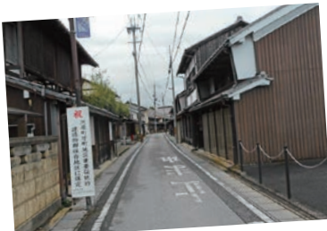
重伝建 河原町芦町地区 L

重要伝統的建造物群保存地区 江戸時代前期の町割り、街路に沿った町家が良好な歴史的風致を形成している。