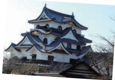
国宝彦根城天守 A B C

琵琶湖を眼下に望む雄大な威容。大きな飾り屋根と窓を複雑に組み合わせたデザインは他の現存天守にはない美しさがある。