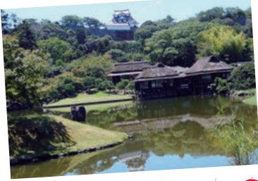
玄宮園 A B C D K

琵琶湖を眼下に望む雄大な威容。大きな飾り屋根と窓を複雑に組み合わせたデザインは他の現存天守にはない美しさがある。