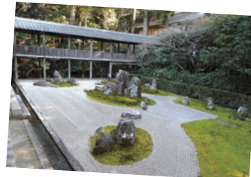
龍潭寺 F G

彦根藩井伊家歴代藩主の菩提寺。石田三成家老島左近の屋敷跡と伝わる。 *室内の拝観はできません