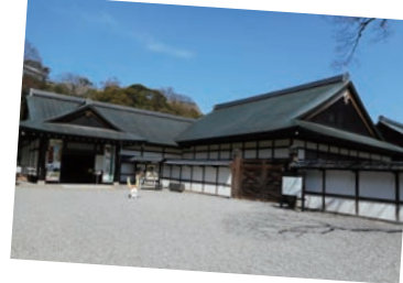
彦根城博物館 B D

国宝彦根城天守を借景とし、水を巧みに利用した池泉回遊式大名庭園。優美な江戸時代の庭園の美を鑑賞できる。