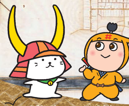
ひこちゃん