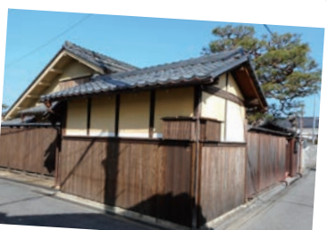
善利組足軽組屋敷 E I

井伊家藩主の私的なお寺。木造五百羅漢が一体も欠けず全部をそろっている。井伊直弼の供養塔がある。