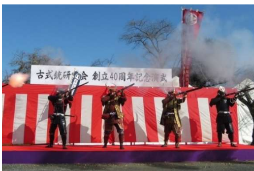
▲古式銃研究会による創立 40 周年記念演武