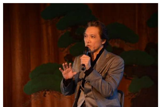
▲彦根城博物館でのプレミアトークショー